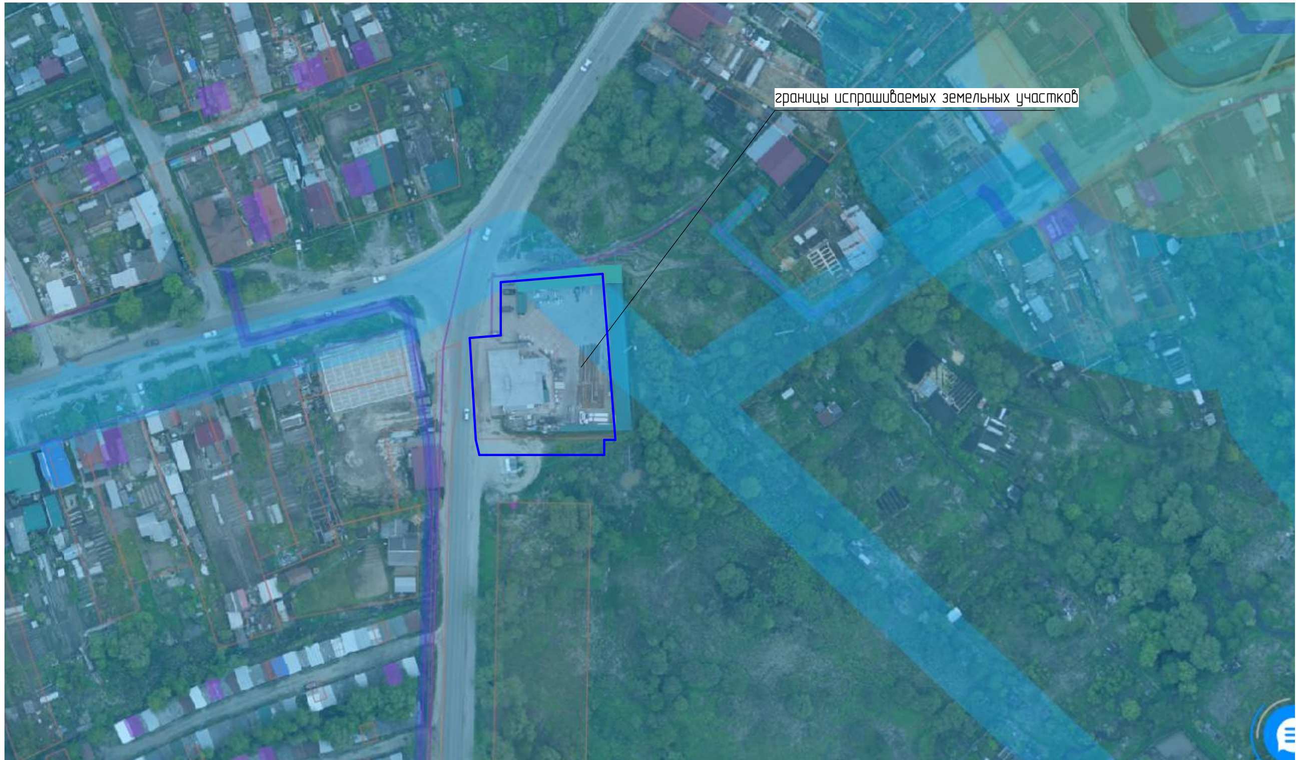
Схема расположения элементов в планировочной структуре